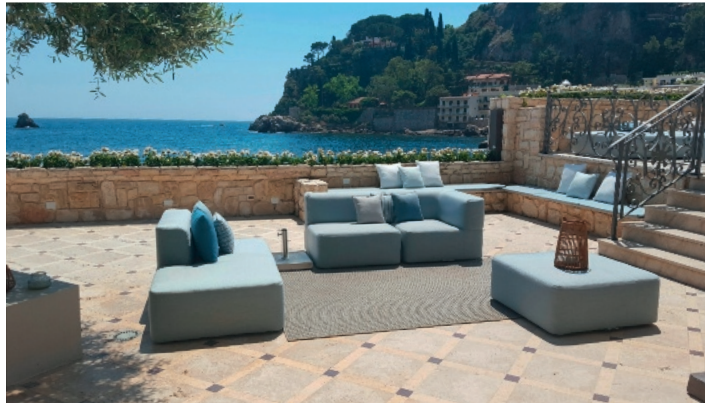
Date of Handover 2019 Furniture products Clever_ Belt_